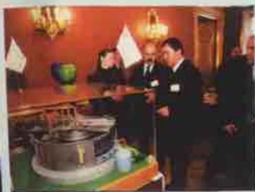
Посетители выставки осматривают макет совместного комплекса очистных сооружений города Немана и НЦБК

Общий объем вложений в инфраструктуру Неманского района и Калининградской области составит около 5 23,5 млн