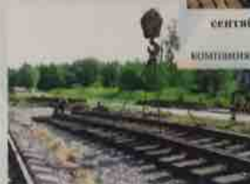
июль 2006 - завершено строительство подъездных железнодорожных путей