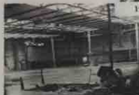
1997 - завод стоит. Цеха опустели. Оборудование вывозится и продается на металлолом