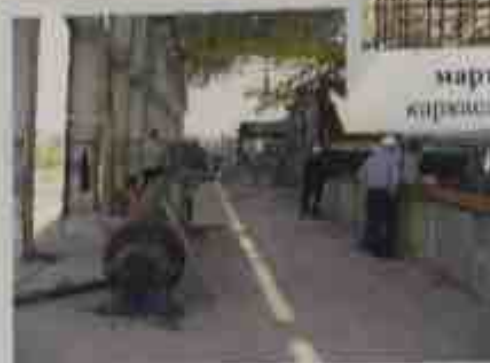
июль 2005 - начал монтаж бумагоделательной машины №9