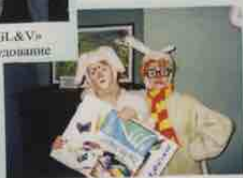
Школьники Калининграда получают в подарок книги, отпечатанные на бумаге СЗЛК