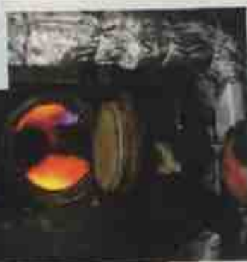
ТЭЦ НЦБК работает на природном газе