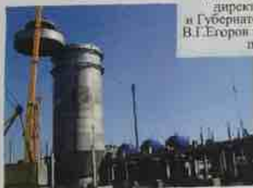
2006 - строительство нового целлюлозного производства

Запущены тетрадно-литовальная линия и линия по производству офисной бумаги Bielomatik.