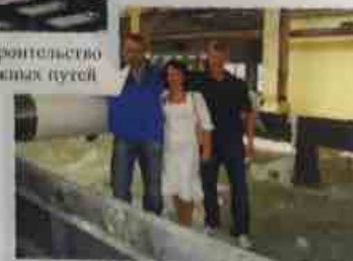
июль 2006 - пробный запуск бумажной фабрики №3 НЦБК