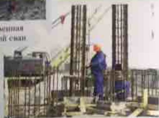
март 2005 - начался монтаж каркаса здания бумажной фабрики №3