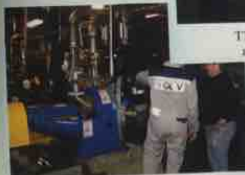
Специалисты фирмы «GL&V» осматривают новое оборудование