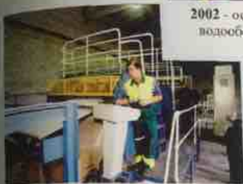
октябрь 2002 - заработала линия Masson Scott