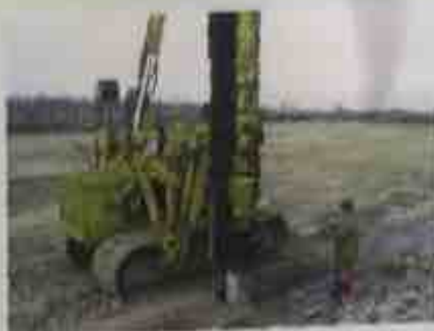
декабрь 2004 - торжественная церемония закладки первой сваи

Продажи новых бумаг СЗЛК начались еще до запуска бумажной фабрики №3 - с июля 2006 г.