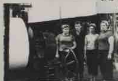
1950-е - в бумажном цехе