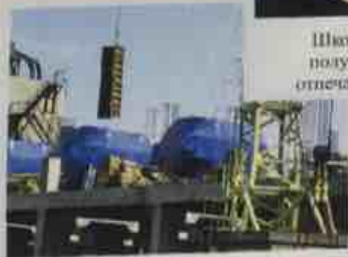
Строительство нового целлюлозного производства