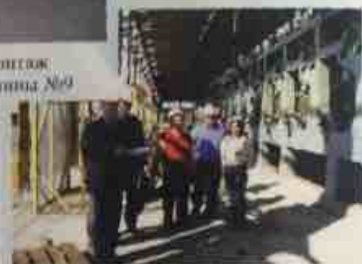
сентябрь 2005 - в шеф-монтажу БДМ-9 приступила компания-производитель «Voith Paper»