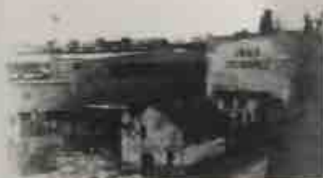
1932 - вид на отбельный цех

2000-2003 – развития предприятия. Управляющей компанией СЗЛК взят курс на модернизацию производства с учетом современных требований к охране окружающей среды. Установлены системы замкнутого водооборота на основе флотаторов «KWI» на двух бумфабриках и в целлюлозном цехе НЦБК. Восстановлена вакуум-выпарная станция. Заработала линия по нарезке цифровых форматов бумаг Masson Scott.