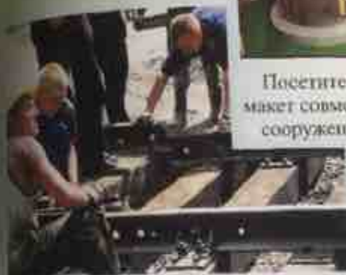
Строительство новых подъездных путей