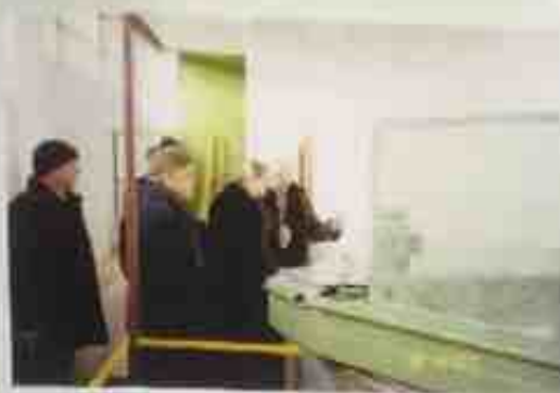
2002 - осмотр систем замкнутого водооборота НЦБК комиссией МПР России