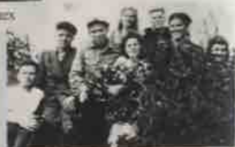
1945 - первые рабочие ЦБК, прибывшие по неманскому путевкам